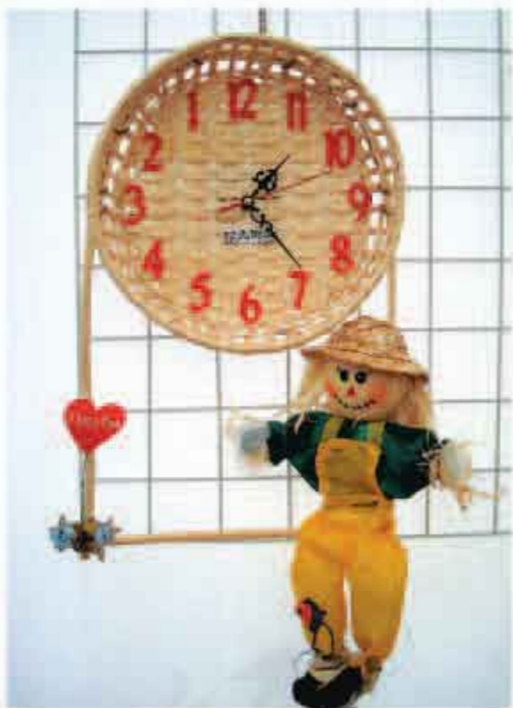
时光不会倒流，付出努力才能拥抱未来

你想知道未来的生活场景吗？听说过“生活墙”吗？来自人民网的消息说，在一个电子信息综合展上，国外某公司通过新的数字技术向世人展示了当今最先进、时尚、新颖的信息生活新概念。例如，客厅的整个一面墙成为大画面电视屏幕，形成一个充满现场感的虚拟交流的世界，这被称为“生活墙”。生活墙可以由家庭成员多人同时自由操控：爸爸可以剪辑、整理旅游拍摄的照片、DV，画面尺寸伸缩、移动自如；妈妈可以同出嫁的女儿视频交流，欣赏外孙成长的照片及视频图像，女儿和外孙都可真人大小；儿子可以跟老师学弹琴或欣赏球赛……家庭成员同时共用一面