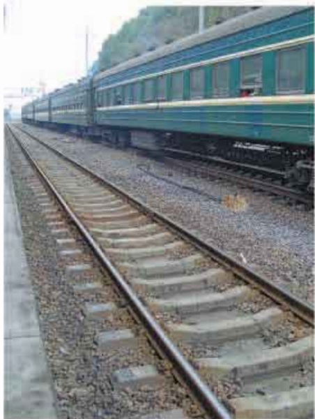
火车带来山外的文明

不久，这条线正式营运，人们挤在村口，看见那绿色的长龙一路呼啸，挟带着来自山外的陌生、新鲜的清风，擦着台儿沟贫弱的脊背匆匆而过。它走得那样急忙，连车轮碾轧钢轨时发出的声音好像都在说：不停不停，不停不停！是啊，它有什么理由在台儿沟站脚呢，台儿沟有人要出远门吗？山外有人来台儿沟探亲访友吗？还是这里有石油储存，有金矿埋藏？台儿沟，无论从哪方面讲，都不具备挽留火车在它身边留步的力量。