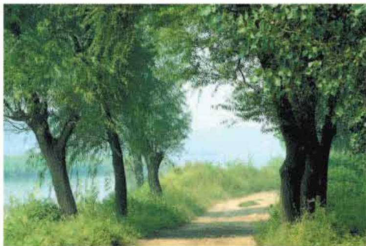
青春是一条不断向前的路

1910年秋天，十七岁的毛泽东离开家乡韶山，到湖南长沙第一师范读书，走向外面更广阔的世界。这是他人生历程中的第一个转折。临行前，他改写了一首诗，夹在父亲每天必看的账本里：“孩儿立志出乡关，学不成名誓不还。埋骨何须桑梓地，人生无处不青山。”这充分表现了他的雄心壮志。