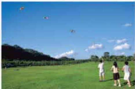
放飞心灵，抒发情志

舒婷，当代诗人。她从小学三年级开始便从大人的书橱里抽取各种各样的书进行阅读。到了初中，更是手不释卷，她先后接触了雨果、巴尔扎克、托尔斯泰、马克·吐温等世界文豪的大量作品。下乡插队时，她把普希金的诗集装进行李中。在农村，她开始写日记，抄录中外大诗人的作品，并把写信当作生活的莫大享受。