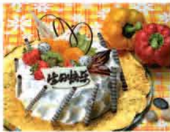
生日是感恩的祝福

你是否记得父母的生日？某学校曾对在校学生进行问卷调查，其中包括“是否记得父母生日”以及“能否为父母送上一份表达情意的礼物”等问题。他们希望通过调查，唤起学生对亲情的重视，学会对父母的养育感恩。然而统计结果令人吃惊，只有9%的学生每年都能记得父母的生日，只有12%的学生给父母送过礼物。其实，父母生