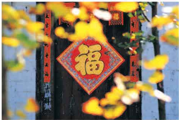
觅对联文化，品融融春意